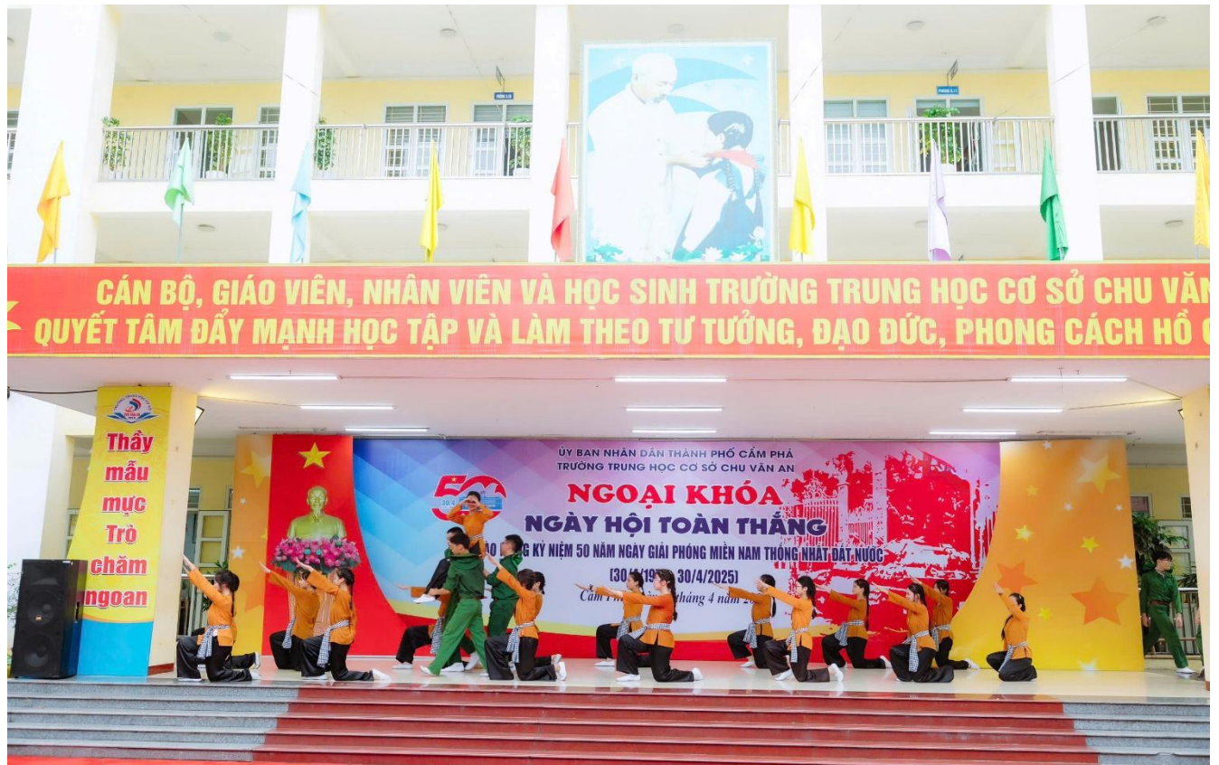
Hoạt cảnh "Miền Bắc tăng gia sản xuất" do các em học sinh khối 7 thể hiện