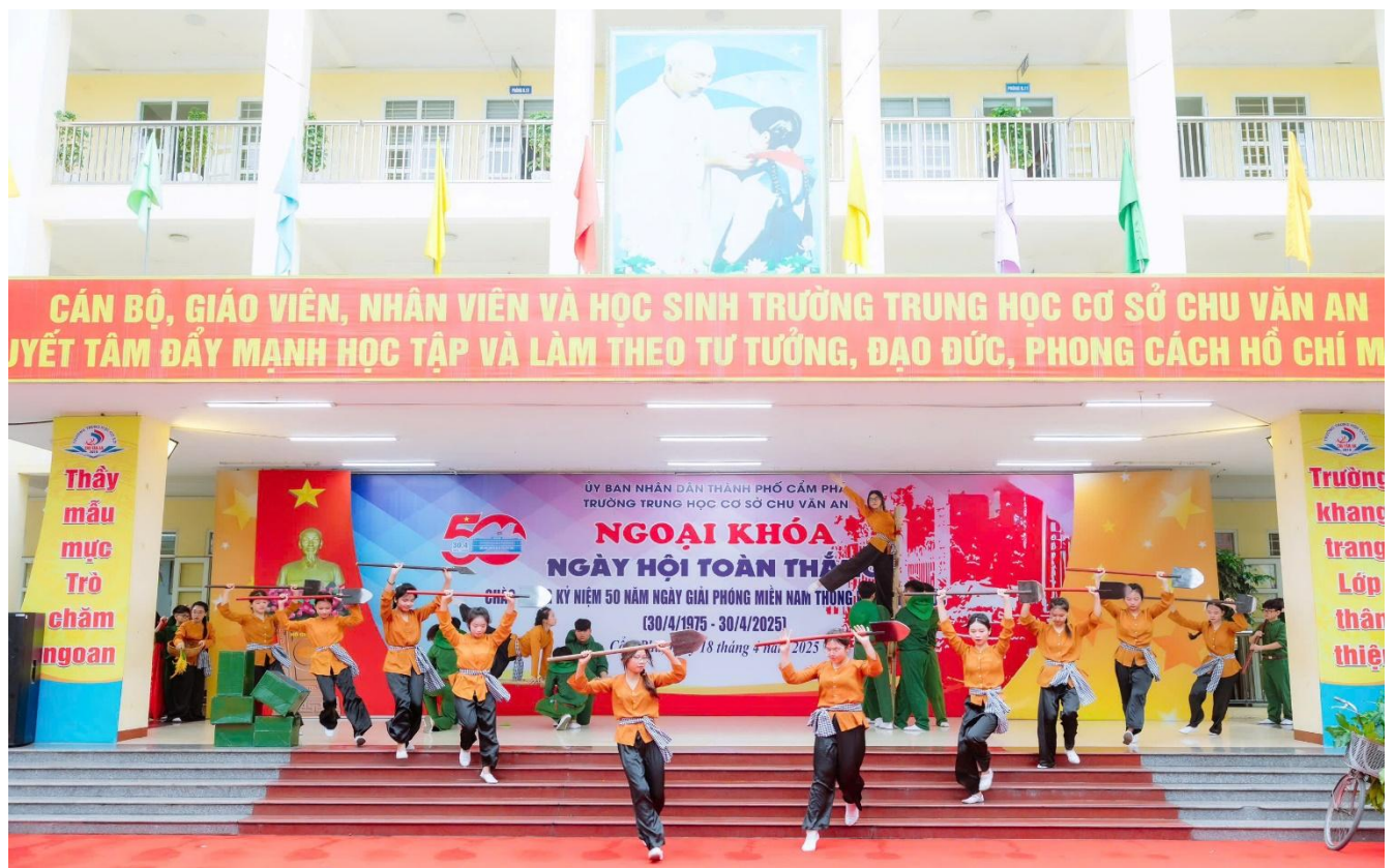
Hoạt cảnh “Miền Bắc tặng gia sản xuất” do các em học sinh khối 7 thể hiện