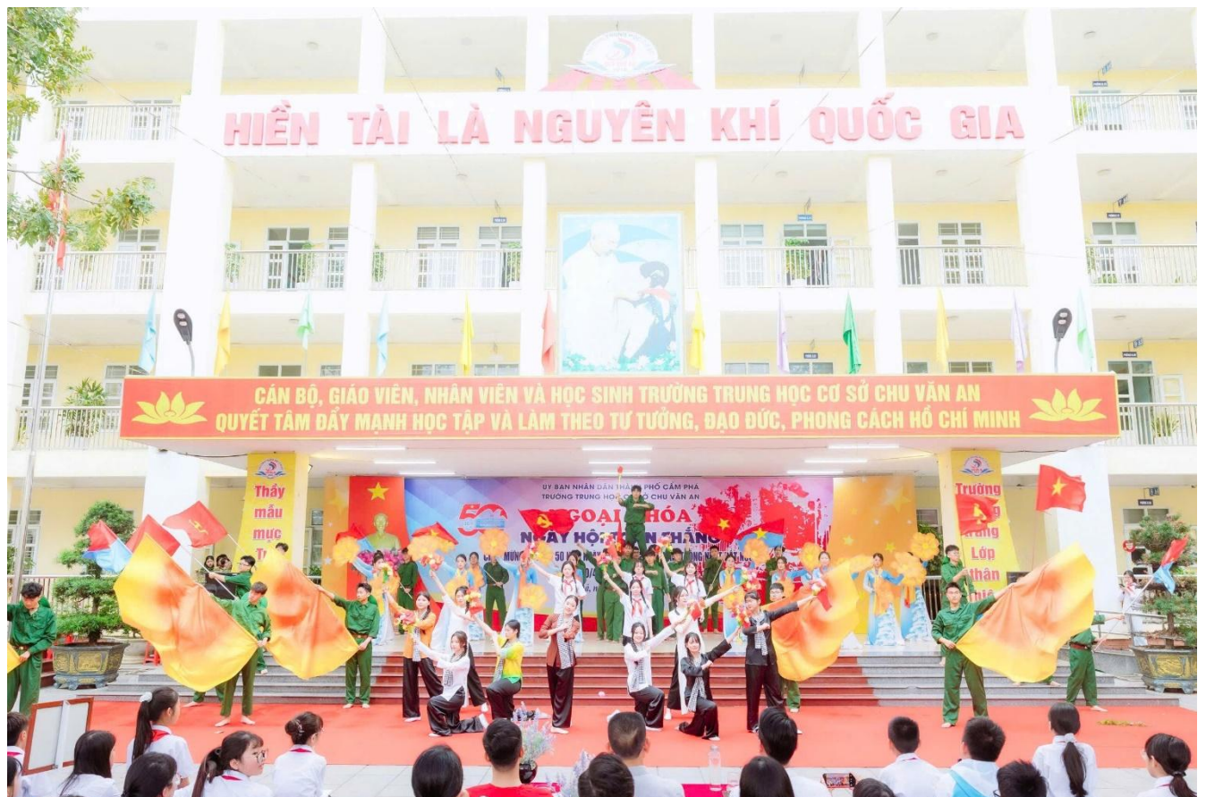
Hoạt cảnh “Kháng chiến thắng lợi – Bắc Nam sum họp” do học sinh khối 9 thể hiện