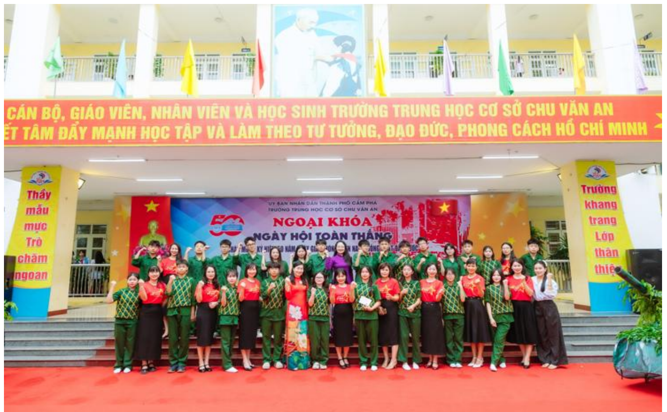
Hình ảnh các em học sinh khối 8 cùng các thầy cô giáo nhà trường