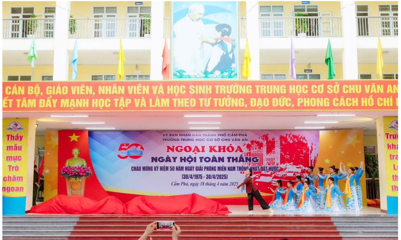
Hoạt cảnh “Kháng chiến thắng lợi – Bắc Nam sum họp” do học sinh khối 9 thể hiện