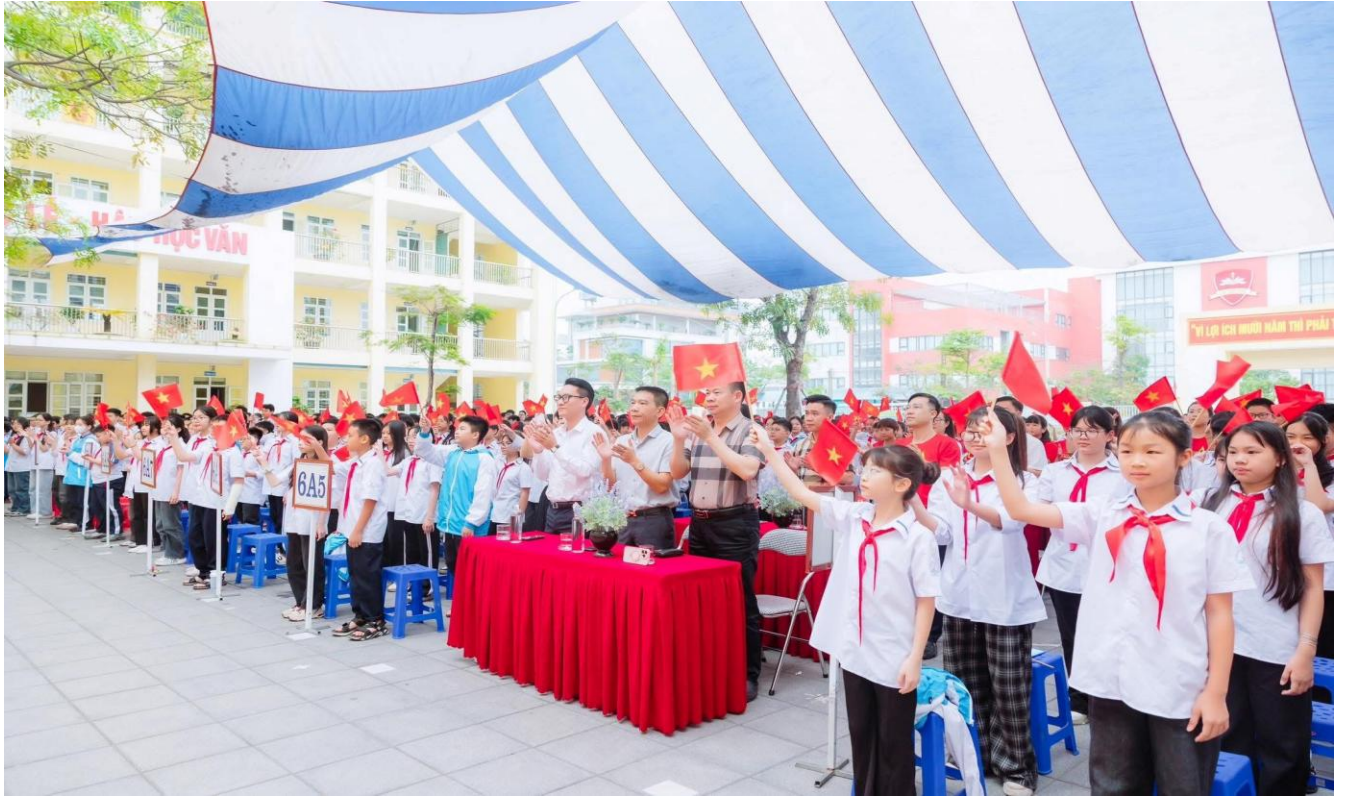
Hình ảnh những em học sinh vẫy cao lá cờ tổ quốc trong giai điệu bài hát “Như có Bác Hồ trong ngày vui đại thắng” của nhạc sĩ Phạm Tuyên

Tuyên gọi niềm xúc động về thời khắc lịch sử huy hoàng của dân tộc – thời khắc đất nước trọn niềm vui, Bắc Nam sum họp một nhà.