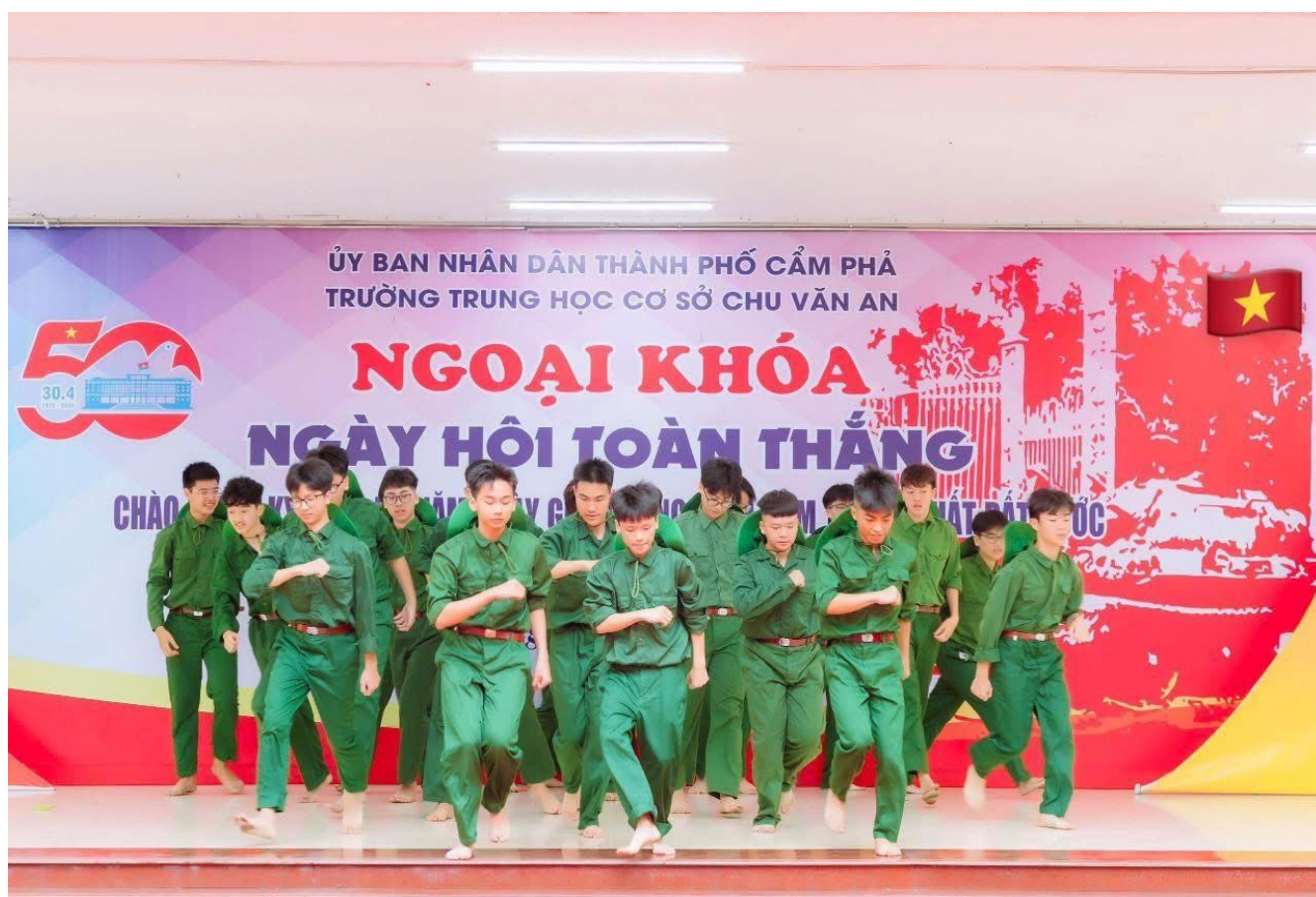
Hoạt cảnh “ Kháng chiến thắng lợi – Bắc Nam sum họp ” do học sinh khối 9 thể hiện

Khép lại chuỗi hoạt cảnh là phần thi của khối 9 với chủ đề “ Kháng chiến thắng lợi – Bắc Nam sum họp ”. Giây phút độc lập nở hoa – hòa bình kết trái của dân tộc được đánh dấu bằng thời khắc thiêng liêng khi bản tin chiến thắng vang lên như tiếng chuông ngân vọng giữa đất trời: “ Mời các bạn nghe tin chiến thắng chúng tôi mới nhận được. Đúng 11h30, quân ta tiến vào Sài Gòn, đánh chiếm Dinh Độc Lập. Bộ Tổng tham mưu - tướng Dương Văn Minh đầu hàng vô điều kiện. Cờ đỏ sao vàng pháp phối tung bay trên nóc Dinh Độc Lập. Chiến dịch Hồ Chí Minh toàn thắng ”. Đây không chỉ là thanh âm chiến thắng mà còn là tiếng gọi của non sông, là lời khẳng định đanh thép rằng: Đất nước đã hoàn toàn thống nhất, giang sơn đã liền một dải. Từ Trường Sơn đến Cà Mau, từ địa đầu Lũng Cú tới mũi đất thiêng liêng của Tổ quốc – trái tim hàng triệu người dân như cùng chung một nhịp đập – nhịp đập của niềm vui chiến thắng. Trong tiếng nhạc sử thi hùng tráng, những bước chân mạnh mẽ của thế hệ học sinh hôm nay hóa thân thành những người lính giải phóng, tiến về Sài Gòn trong tiếng reo vang của nhân dân. Mỗi ánh mắt, mỗi cử chỉ của các em học sinh đều mang theo niềm tự hào và sự biết ơn sâu sắc với thế hệ cha anh. Hoạt cảnh của học sinh khối 9 là minh chứng sống động cho sự tiếp nối truyền thống – nơi thế hệ trẻ hôm nay tái hiện quá khứ hào hùng, khơi dậy niềm tự hào dân tộc và truyền đi thông điệp mạnh mẽ về khát vọng hòa bình và xây dựng tương lai.