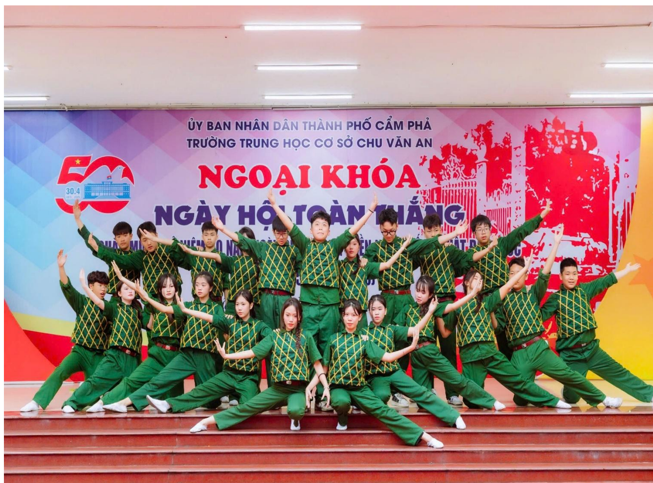
Hoạt cảnh “ Đường lên phía trước – Chiến đấu miền Nam ” do học sinh khối 8 thể hiện

Mạch cảm xúc tiếp tục dâng trào trước hoạt cảnh của Khối 8 với chủ đề “ Đường lên phía trước – Chiến đấu miền Nam ”. Giữa bom rơi, đạn nổ đầy căng thẳng, khốc liệt của chiến trường ác liệt nơi tuyến lửa miền Nam, những người lính Cụ Hồ vẫn âm thầm gùi hàng vượt núi băng đèo. Những chiếc xe thồ chất đầy đạn dược nghiêng mình lặng lẽ men theo đường mòn Trường Sơn, lách qua từng hốc đá, từng khúc cua sinh tử. Bước chân các anh hằn in trên đất đỏ bazan, mồ hôi hòa cùng mưa rừng lạnh giá. Tiếng xe tăng gầm rú, tiếng pháo dội về từ bốn phía, tiếng gọi nhau giữa đêm tối – tất cả hòa quyện thành khúc tráng ca bi tráng của những người con miền Bắc vượt Trường Sơn vào Nam, mang theo tình yêu Tổ quốc, mang theo lời thề “ Xẻ dọc Trường Sơn đi cứu nước, mà lòng phơi phới dậy tương lai ”. Hoạt cảnh không chỉ tái hiện một giai đoạn lịch sử khốc liệt, mà còn là lời tri ân những người đã ngã xuống, để đất nước hôm nay được sống trong hòa bình, độc lập và tự do.