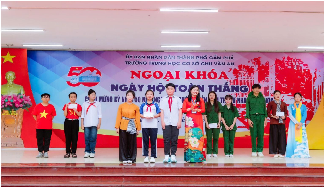
Đội thi: Tất cả vì tiền tuyến – Khối 7 đạt giải Đặc biệt

Sau các phần thi là lễ tổng kết và trao giải. Ban Giám khảo đã làm việc công tâm và kỹ lưỡng để lựa chọn ra những đội thi xuất sắc nhất, xứng đáng với những nỗ lực và sự chuẩn bị công phu. Kết quả chung cuộc: Giải Đặc biệt: Khối 7; Giải Nhất: Khối 9; Giải Nhì: Khối 8; Giải Ba: Khối 6.