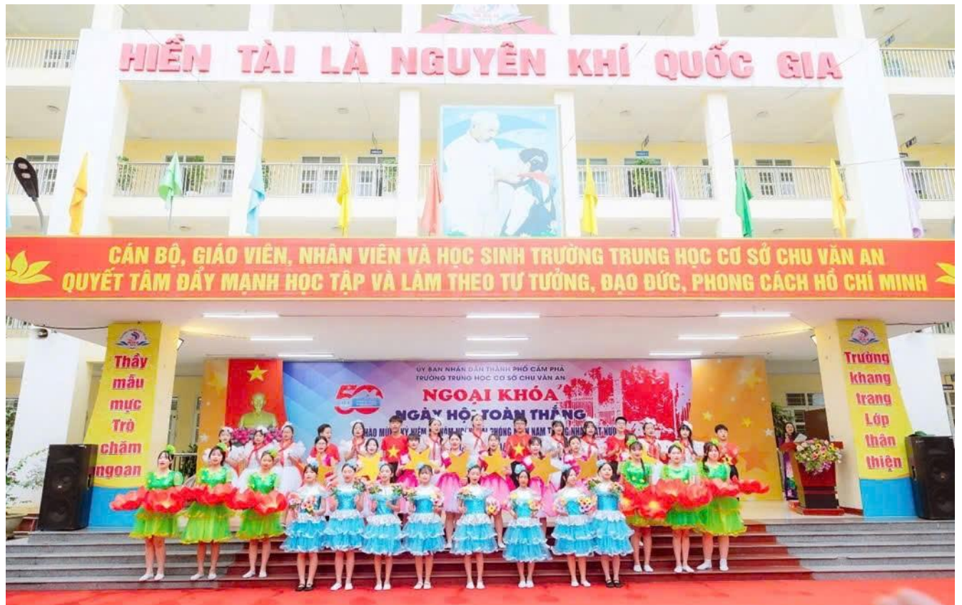
Tiết mục văn nghệ do các em trong câu lạc bộ nghệ thuật nhà trường biểu diễn