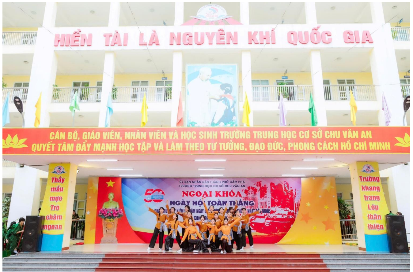
Hoạt cảnh “Miền Bắc tăng gia sản xuất” do các em học sinh khối 7 thể hiện