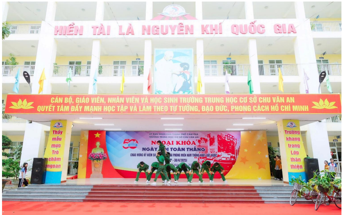
Hoạt cảnh “Miền Bắc tặng gia sản xuất” do các em học sinh khối 7 thể hiện