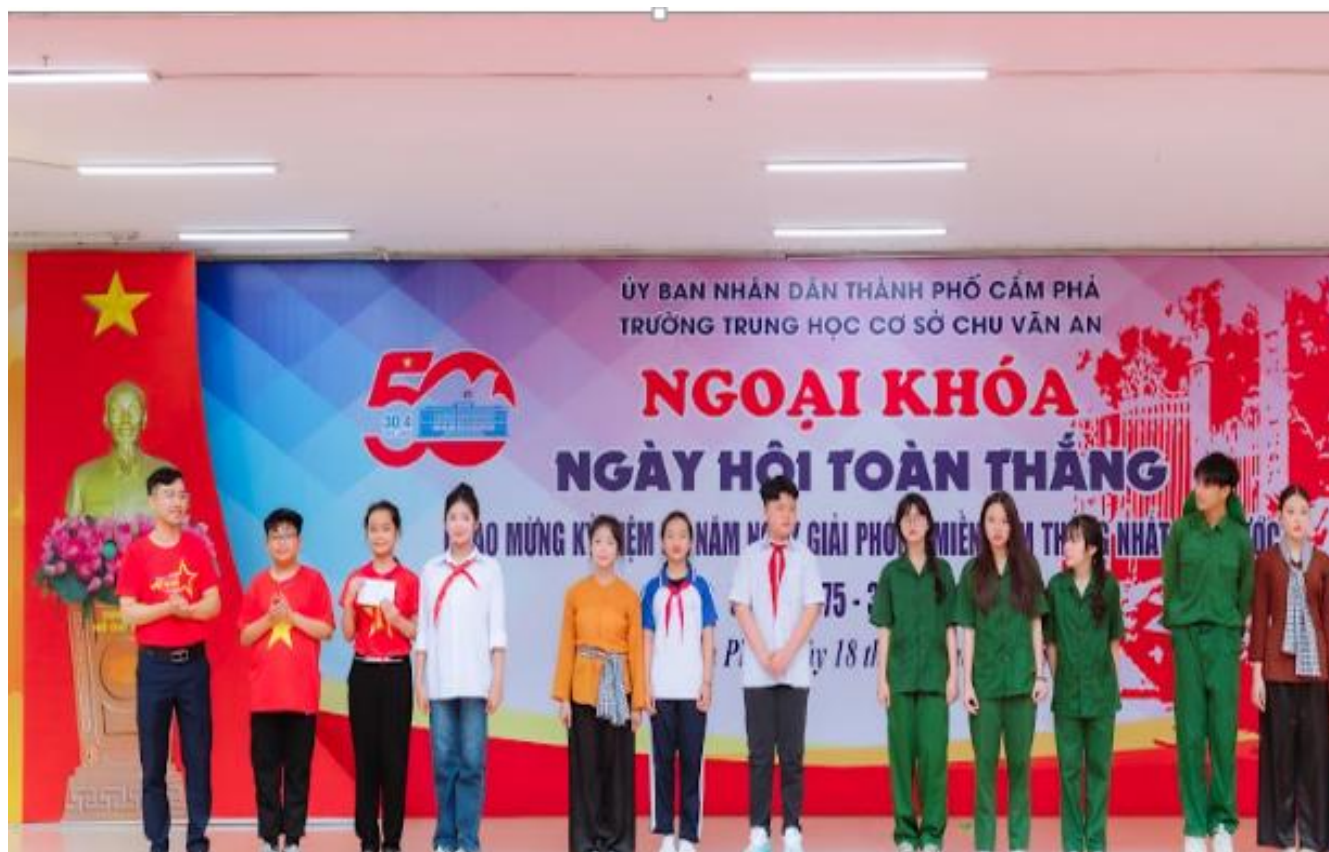
Đội thi: Đất nước đứng lên – Khối 6 đạt giải Ba