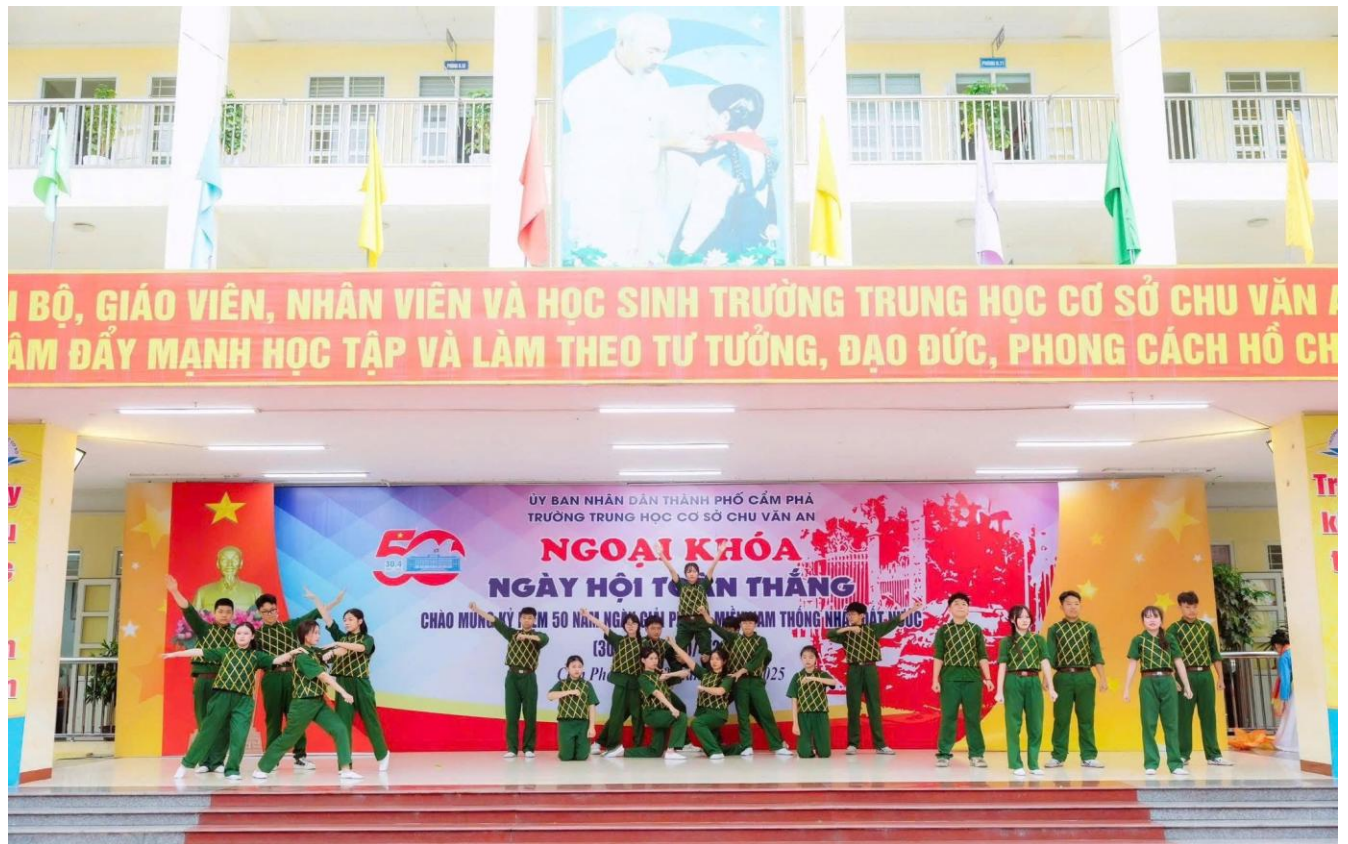
Hoạt cảnh “Đường lên phía trước – Chiến đấu miền Nam” do học sinh khối 8 thể hiện