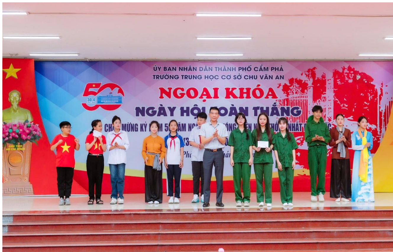
Đội thi: Đường lên phía trước – Khối 8 đạt giải Nhì