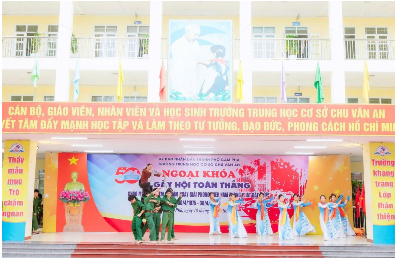
Hoạt cảnh “Kháng chiến thắng lợi – Bắc Nam sum họp” do học sinh khối 9 thể hiện