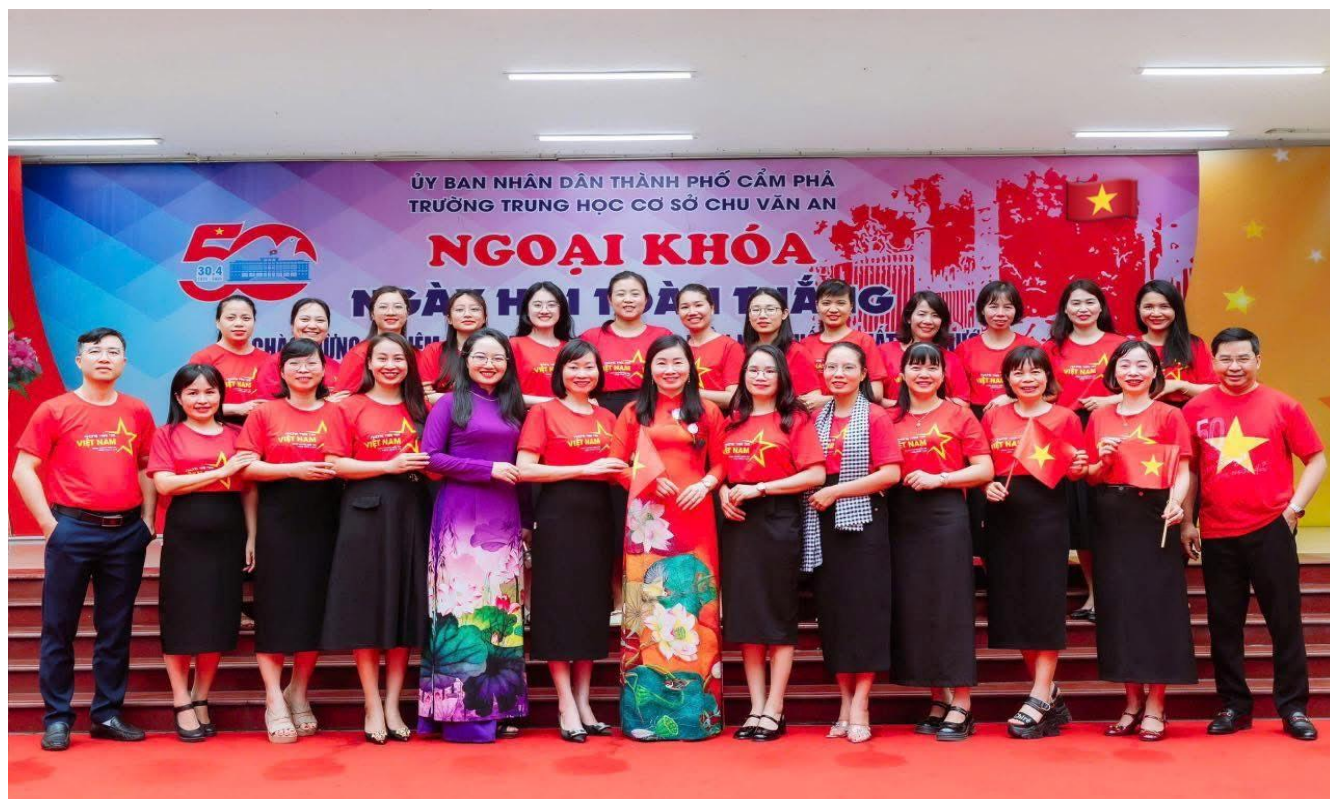
Tập thể cán bộ, giáo viên, nhân viên trường THCS Chu Văn An năm học 2024 - 2025