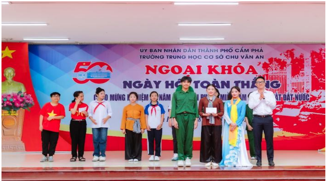
Đội thi: Đất nước trọn niềm vui – khối 9 đạt Giải Nhất