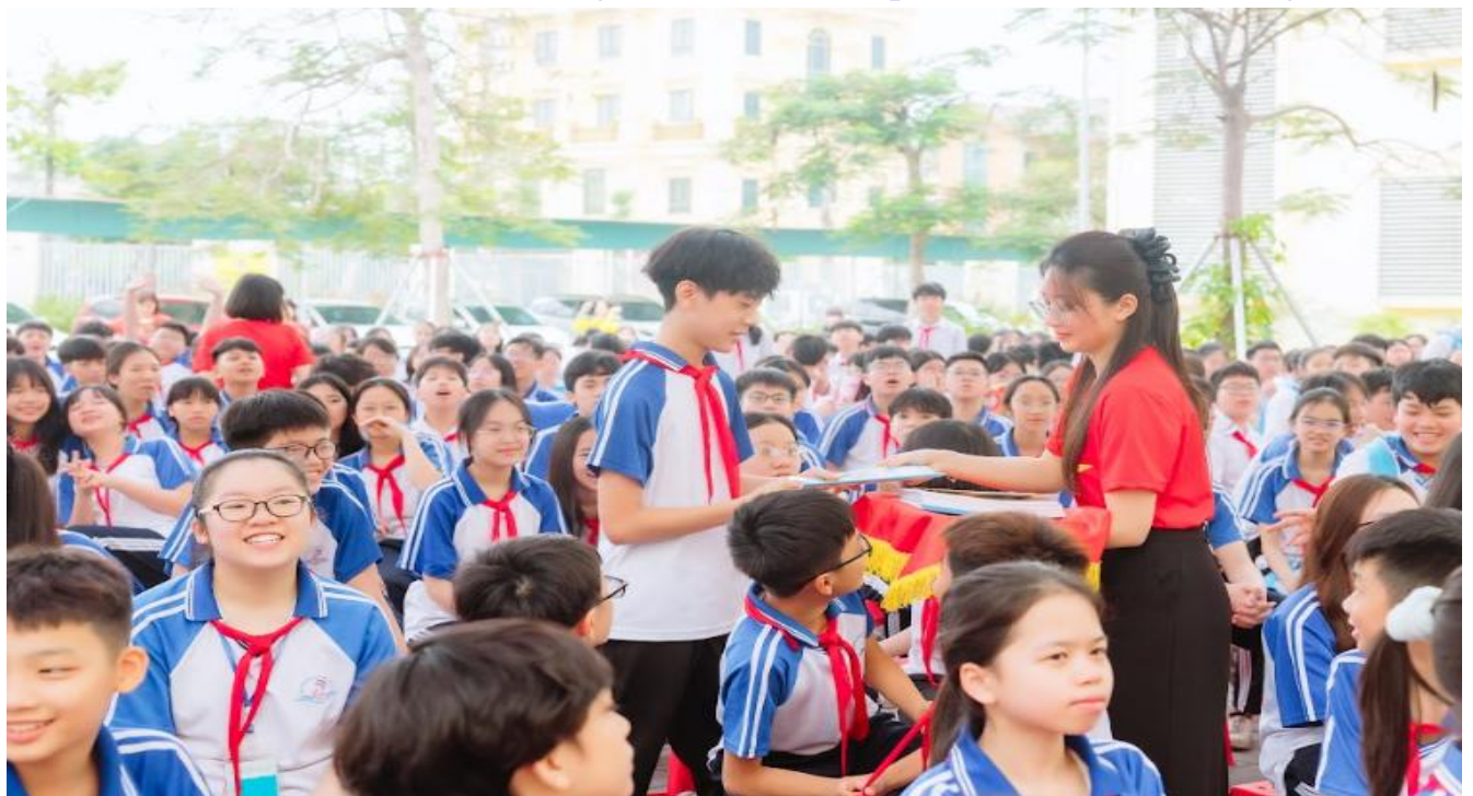
Các em học sinh nhận phần thưởng trong phần thi dành cho khán giả