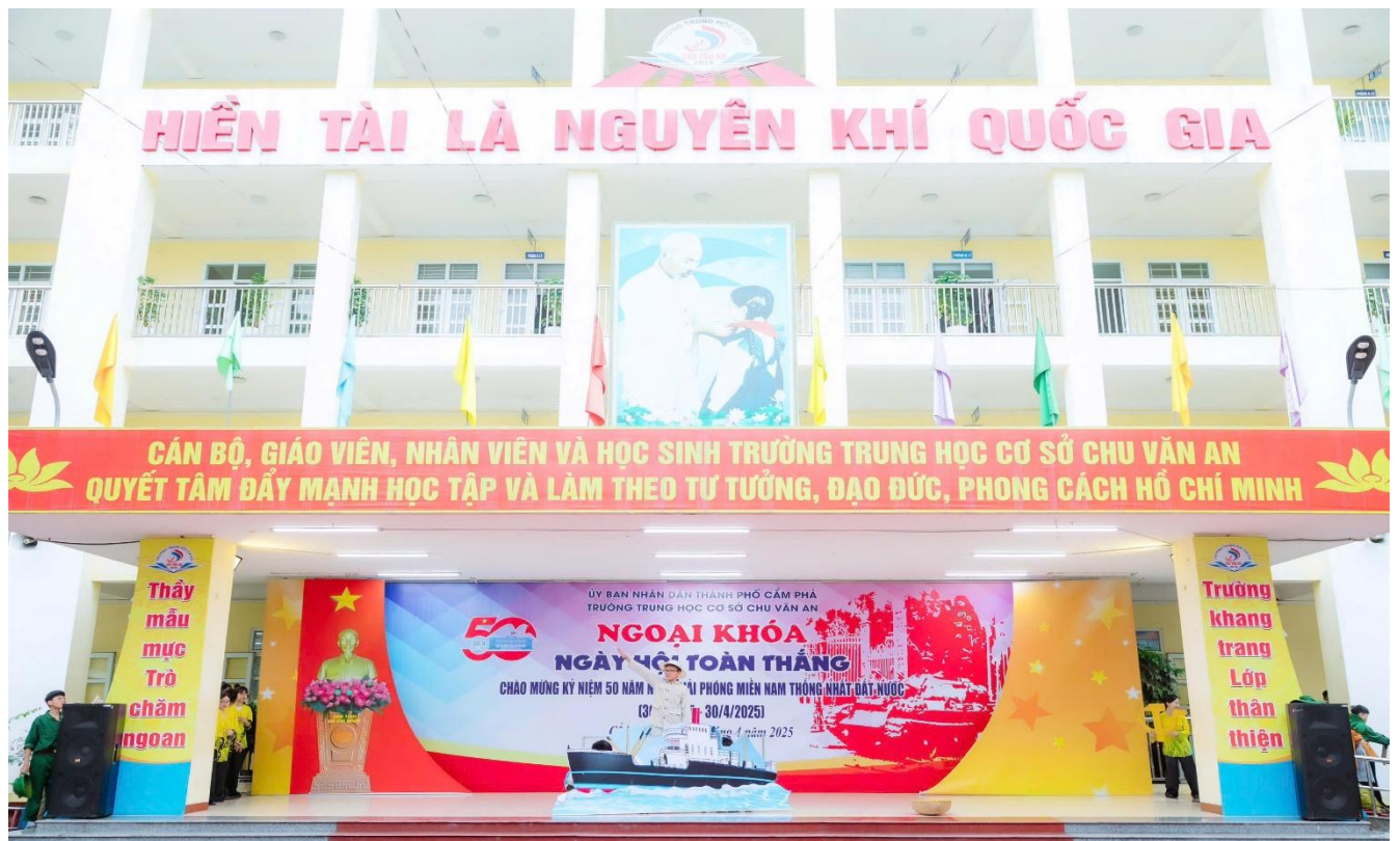
Hình ảnh người thanh niên Nguyễn Tất Thành ra đi tìm đường cứu nước trong hoạt cảnh với chủ đề “Đất nước đứng lên” do học sinh khối 6 thể hiện