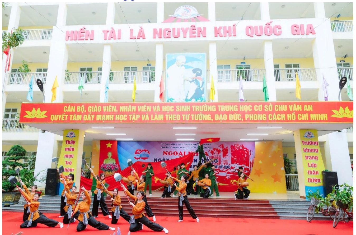
Hoạt cảnh “Miền Bắc tăng gia sản xuất” do các em học sinh khối 7 thể hiện