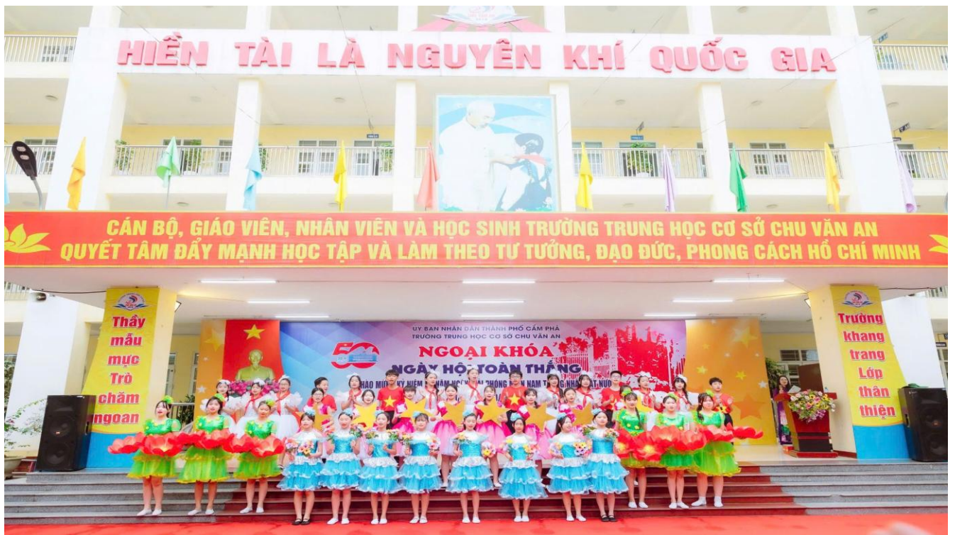
Tiết mục văn nghệ do các em trong câu lạc bộ nghệ thuật nhà trường thể hiện