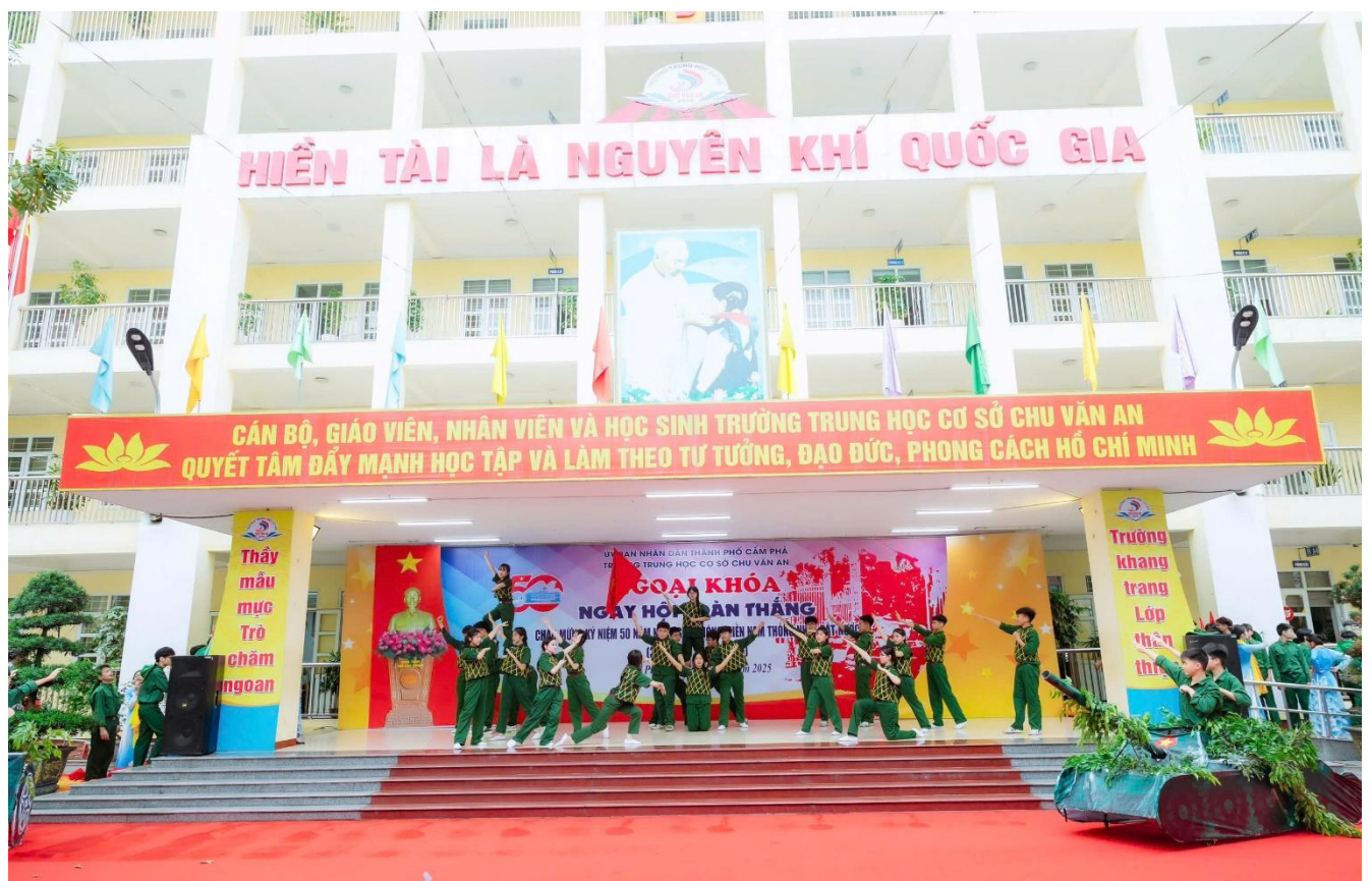
Hoạt cảnh “Đường lên phía trước – Chiến đấu miền Nam” do học sinh khối 8 thể hiện