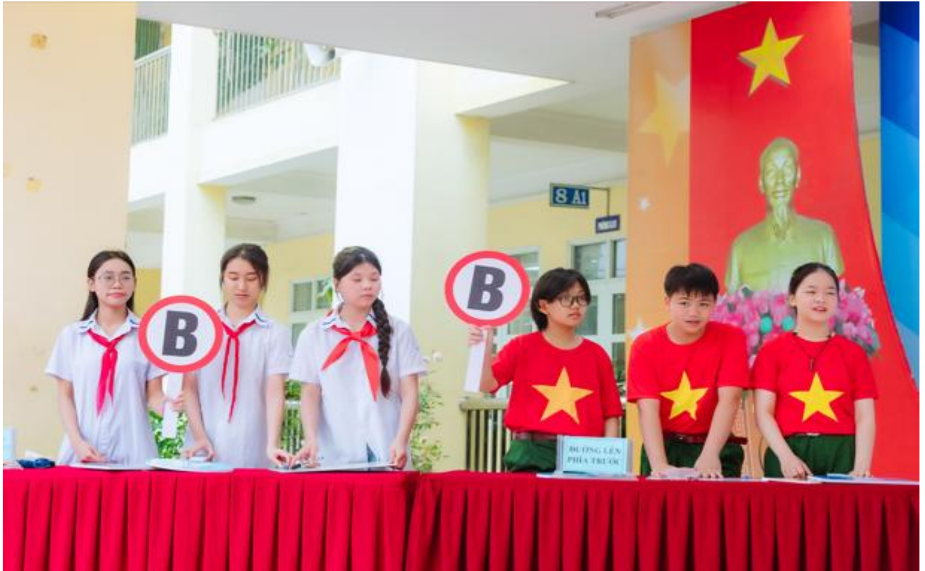
Bốn đội thi so tài trong phần thi “Hiểu biết lịch sử”

Tiếp đến là phần thi Tài năng – nơi mà ánh đèn sân khấu trở thành dòng chảy ký ức và các em học sinh trở thành những người kể chuyện lịch sử bằng trái tim yêu nước. Những màn sử thi được dàn dựng công phu, đong đầy cảm xúc đã khắc họa chân thực những giai đoạn kháng chiến đầy gian khổ, đưa người xem trở về những năm tháng khói lửa chiến tranh.