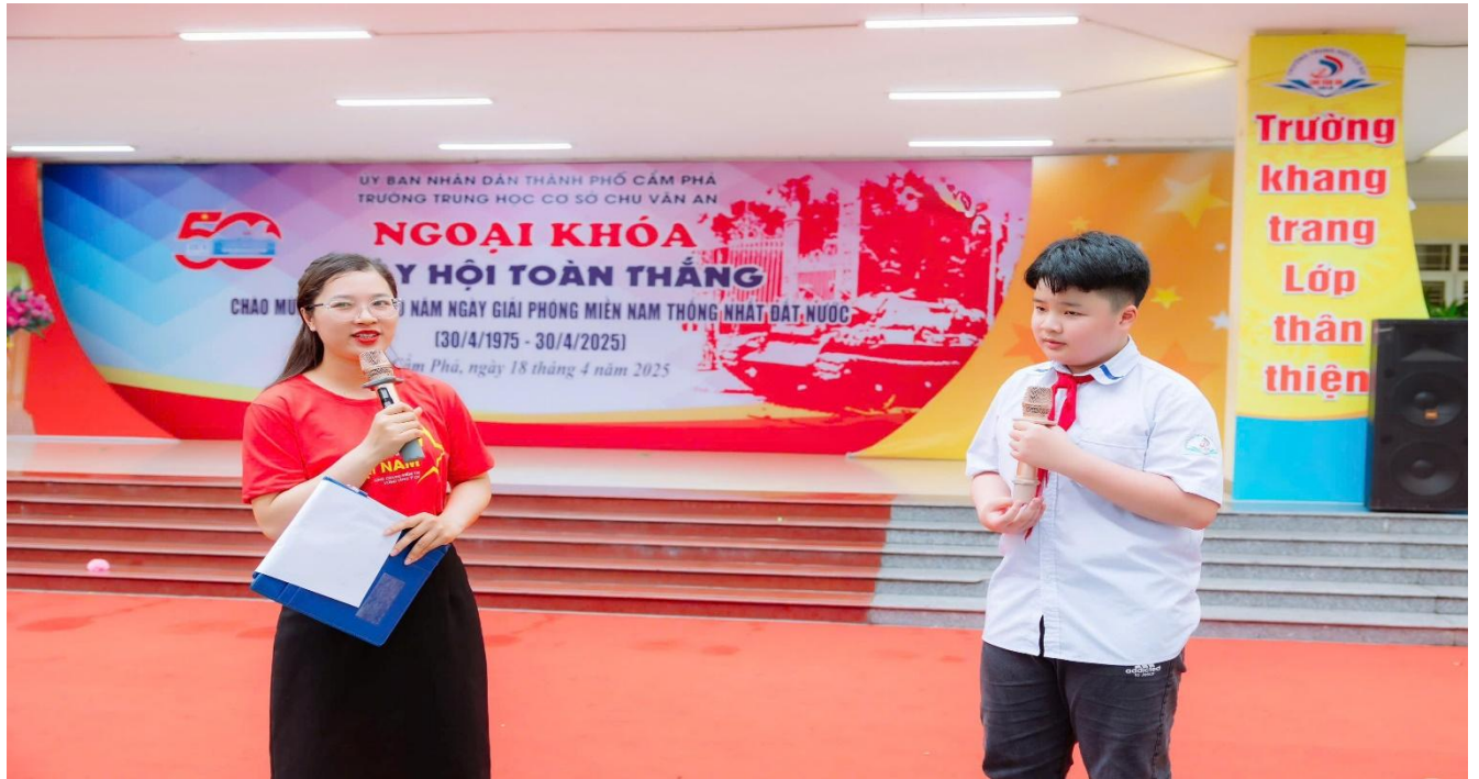
Các em học sinh tham gia trả lời câu hỏi phần thi dành cho khán giả

Không khí ngày hội tiếp tục tung bừng rộn rã với phần thi dành cho khán giả. Những cánh tay giơ cao như những ngọn lửa nhiệt huyết, những câu trả lời vang lên đồng loạt, mang theo âm hưởng của lòng say mê lịch sử, của tình yêu Tổ quốc thiết tha. Các em học sinh hào hứng khi được tham gia trả lời các câu hỏi, niềm vui và sự tự hào lan tỏa trong từng cử chỉ, khiến không khí ngày hội thêm phần náo nhiệt và tràn đầy năng lượng.