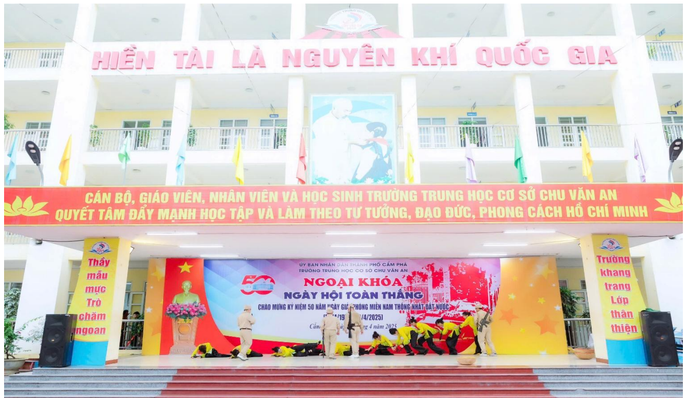
Hoạt cảnh với chủ đề “Đất nước đứng lên” do học sinh khối 6 thể hiện