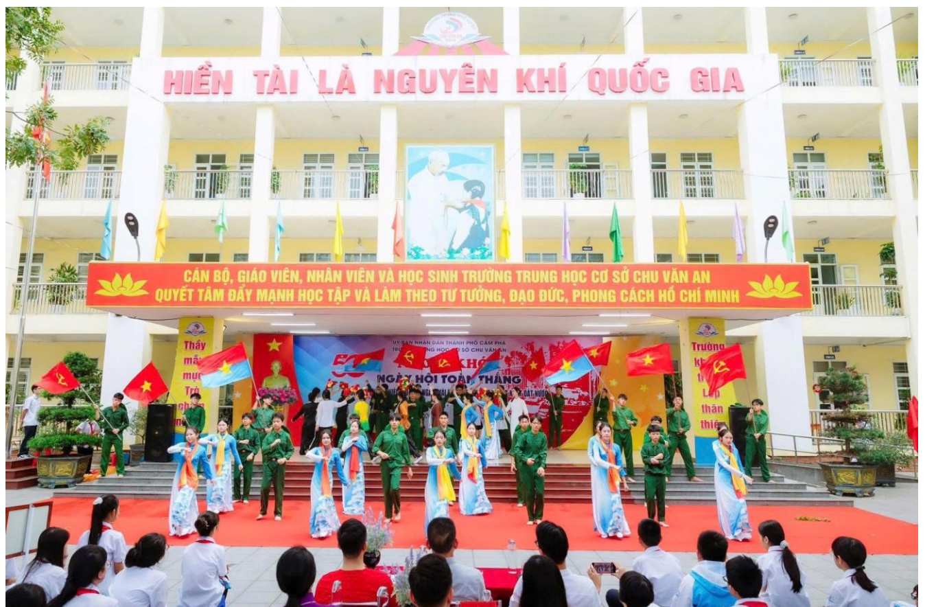
Hoạt cảnh “Kháng chiến thắng lợi – Bắc Nam sum họp” do học sinh khối 9 thể hiện