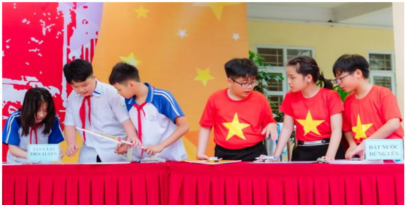
Bốn đội thi so tài trong phần thi “Hiểu biết lịch sử”