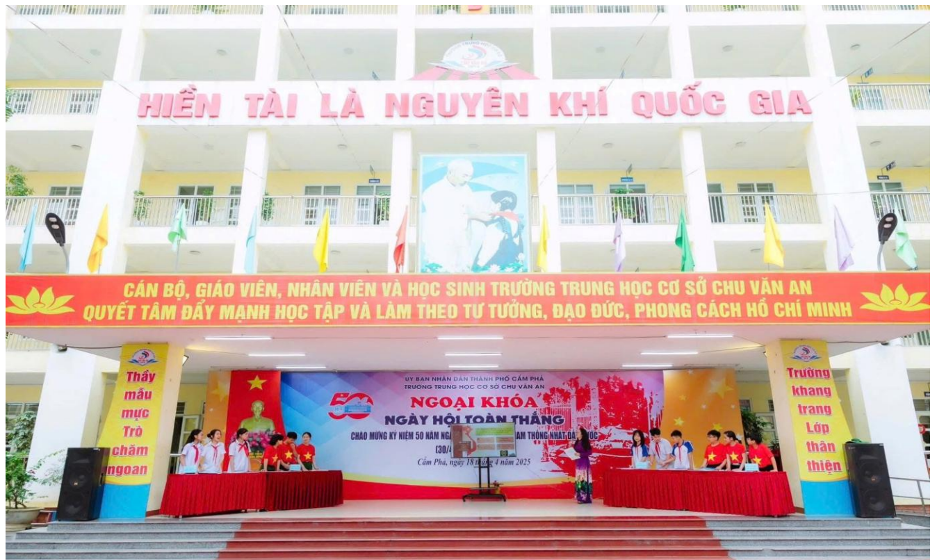
Bốn đội thi so tài trong phần thi “Hiểu biết lịch sử”

hành trình đưa mỗi chúng ta trở lại những mốc son lịch sử chói lọi của dân tộc. Những tràng vỗ tay nồng nhiệt của thầy trò Trường THCS Chu Văn An chính là minh chứng sống động cho sức mạnh lan tỏa của tình yêu dân tộc, thể hiện niềm tự hào về những trang sử vàng son của đất nước.