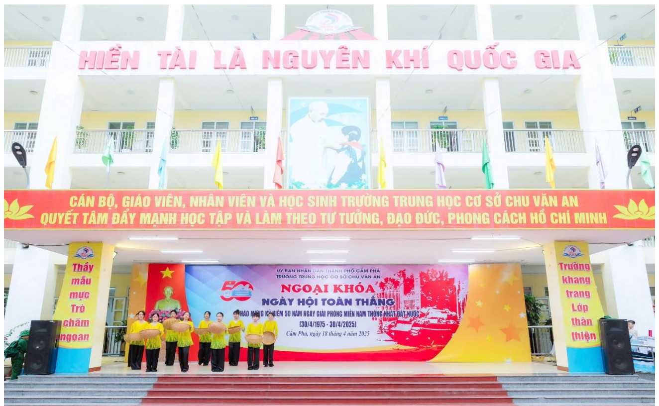
Hoạt cảnh với chủ đề “Đất nước đứng lên” do các em học sinh khối 6 thể hiện